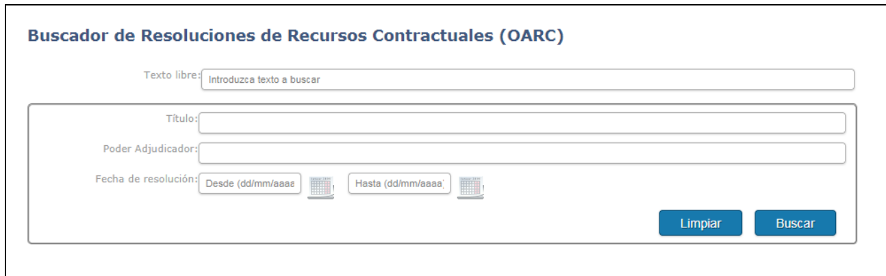
Ilustración 2 Búsqueda de resoluciones

La pantalla dispone de la siguiente información: